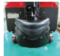
補助車輪+フットガード (オプション)