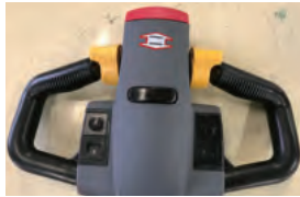
簡単わかりやすい操作ハンドル