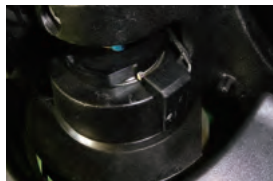
コーナー時は自動減速で、荷物の転倒を軽減させます