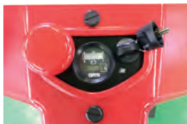
バッテリー残量がひと目でわかるインジケータ付き