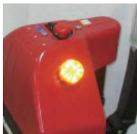
パトライト (オプション)