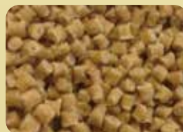
ウッドプラスチック