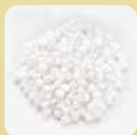
グリーンポリエチレン