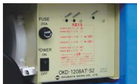
搭載型バッテリー充電器 (AC100V) コードリール付 (コード長さ約1.5m)